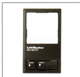
Panneau de commande multifonction

La norme en matière de contrôle. Commande le fonctionnement de la porte et de l'éclairage depuis l'intérieur du garage. Verrouille tous les signaux radio extérieurs lorsque vous êtes absent. Comprend une minuterie réglable et un bouton-poussoir surdimensionné lumineux.